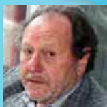
Claude CHARLES Centre